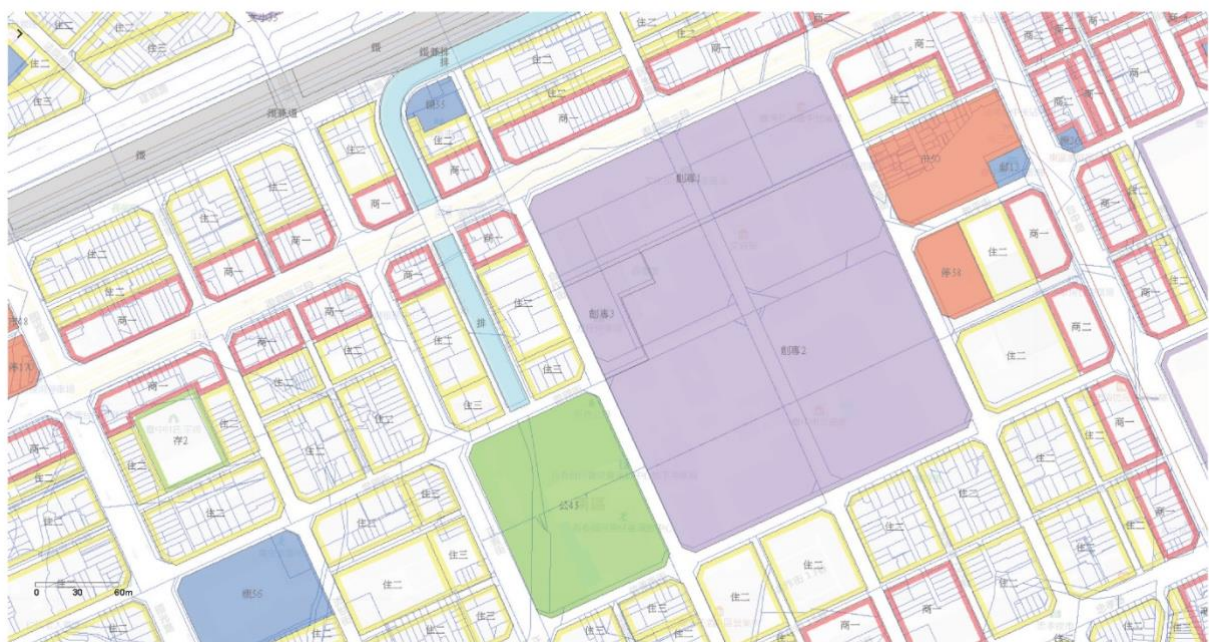
附圖 2 都市計畫圖