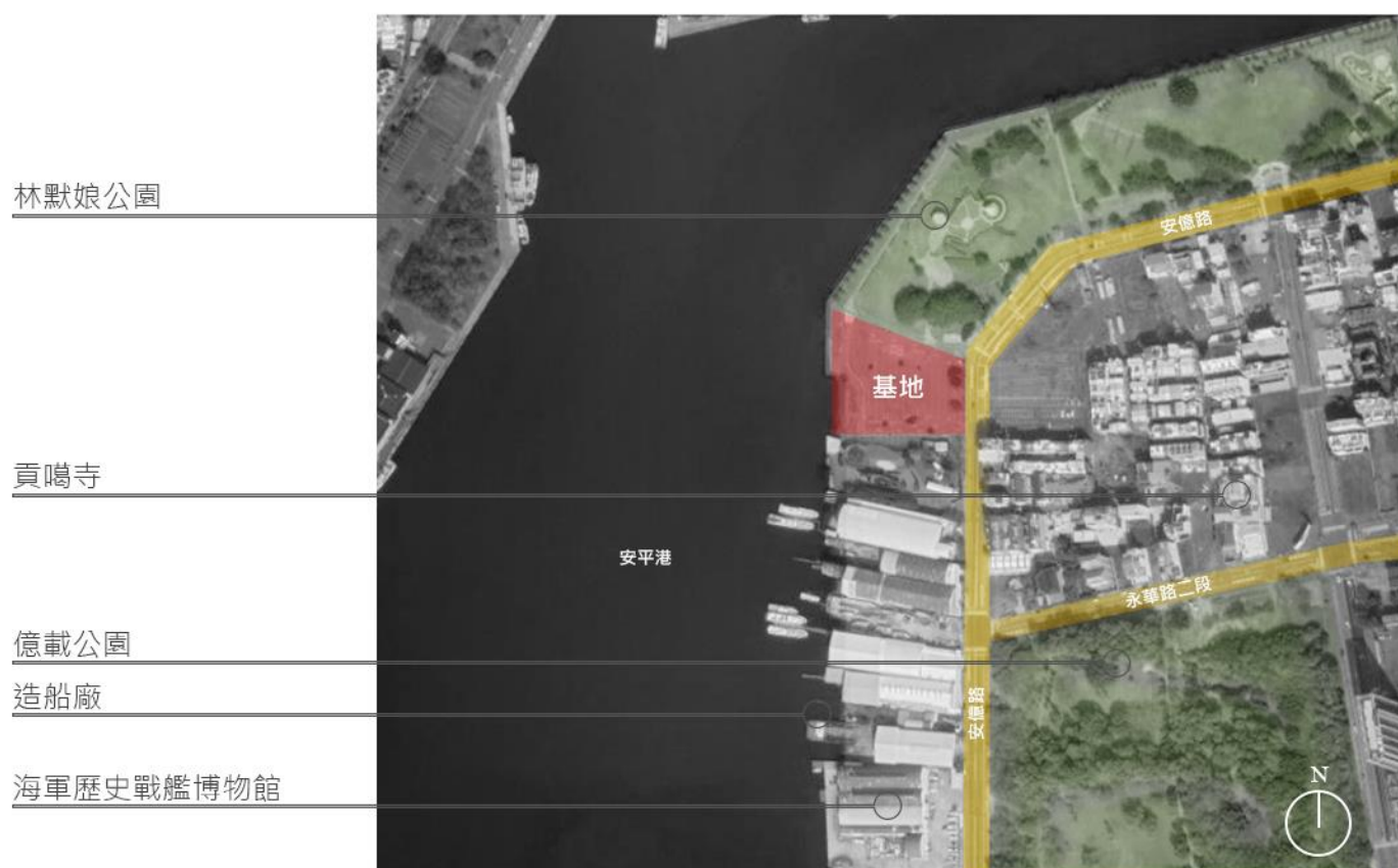
附圖 1 基地位置圖

基地位於林默娘公園收費停車場(如附圖 1)，都市計畫詳附圖 2，東北側基地線以公園地界作為參考點，整體基地呈梯形狀(南北走向) 詳附圖 3，總面積約為 8,533 平方公尺，詳細尺寸如附圖 4。