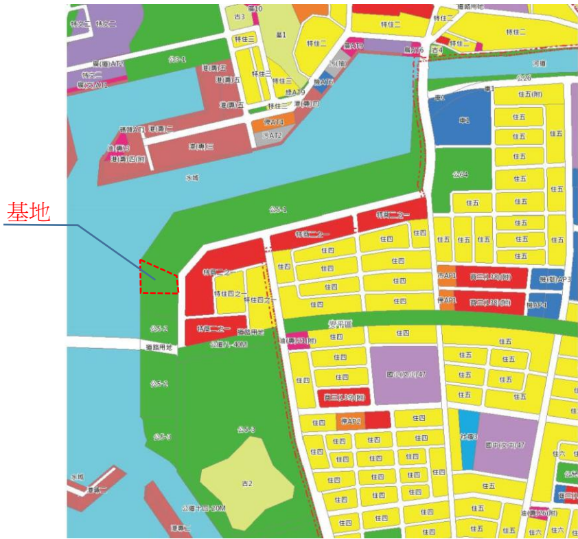
附圖 2 都市計畫圖